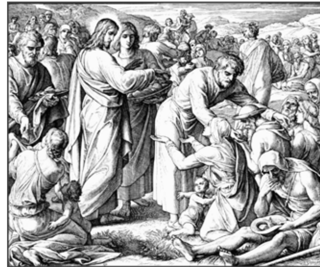
Юлиус Шнорр. Насыщение пяти тысяч. 1852–1860.

«Потом берет Его диавол в святой город и ставляет Его на крыле храма, и говорит Ему: если Ты Сын Божий, бросься вниз, ибо написано: "Ангелам Своим заповедает о Тебе, и на руках понесут Тебя, да не преткнешься о камень ногою Твоею"» (Мф. 4:5-6). Историки полагают, что высота крыла храма была не менее пятидесяти метров. Заманчивое предложение: прыгнуть с такой высоты на глазах народа и служителей храма и приземлиться невредимым! Тогда уж, как многим кажется, все бы уверовали! Но Христос и на это искушение отвечает словами Писания: «...написано также: "не искушай Господа Бога твоего"» (Мф. 4:7). Другими словами, Библия запрещает нам рисковать жизнью и здоровьем с целью кого-то удивить и тем самым заработать себе признание. Рисковать можно только ради благородных целей, например при спасении, если выбрал профессию спасателя, или в чрезвычайных ситуациях, когда жизнь твоя или кого-то рядом зависит от рискованного поступка. Апостол Павел часто