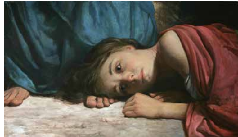
Андрей Миронов. Христос и грешница. 2011.

Давай теперь откроем Новый Завет. Фарисеи и учителя закона учили народ правильно поступать согласно предписаниям Торы, но за ложной внешней чистотой законничества скрывалась