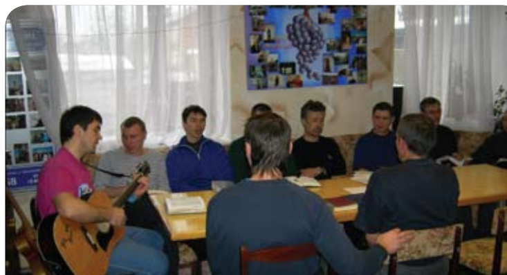
Общение в центре. Видео смотрите на сайте www.rcr.ru в разделе "Дом Пиркко"