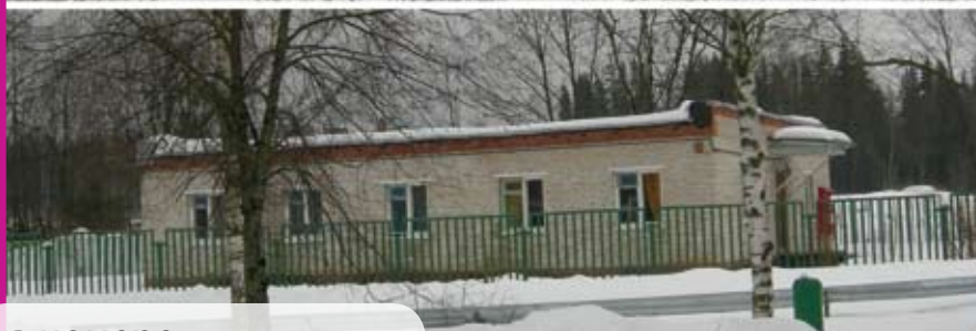
центр адаптации в Румянцево