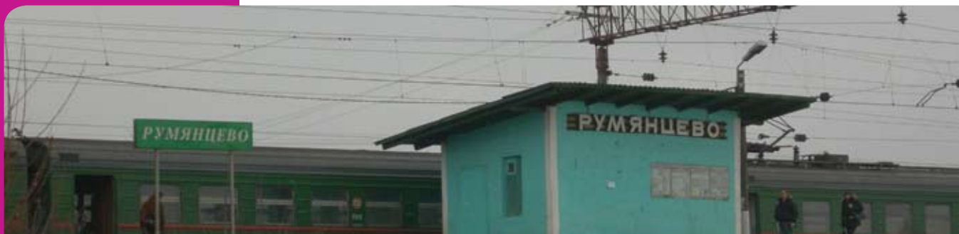
железнодорожная станция "Румянцево"