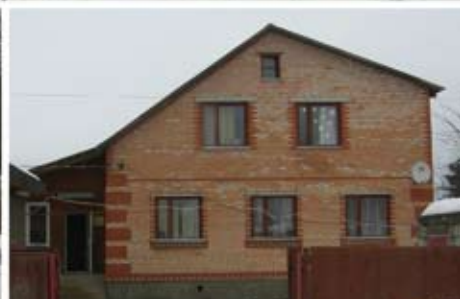
центр реабилитации в Румянцево