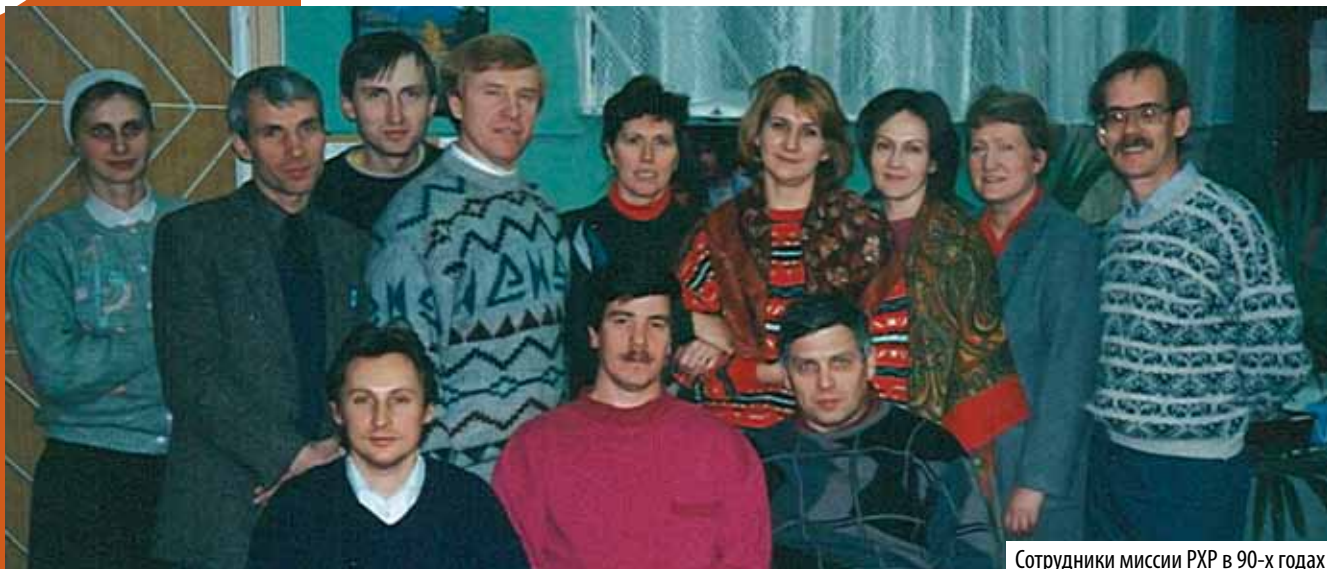
Сотрудники миссии РХР в 90-х годах