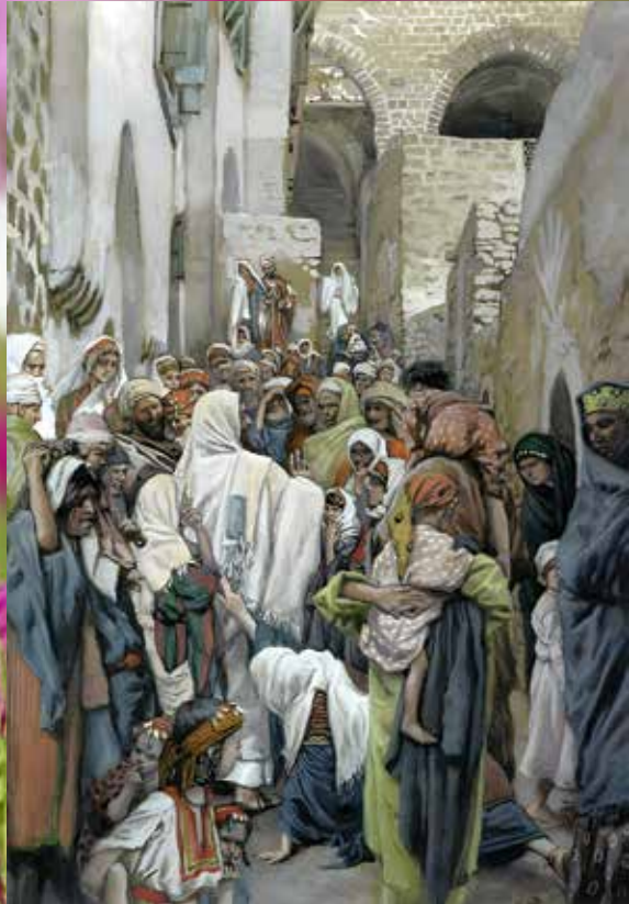
Джеймс Тиссо. Исцеление кровотоочивой. 1886–1896.