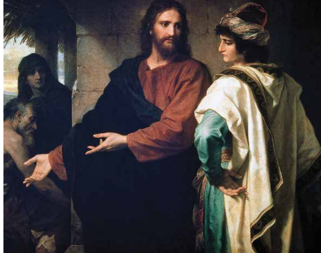
Генрих Гофман. Христос и богатый юноша. 1889.

И вот первый факт, с которым мы столкнулись, заключается в том, что ни наша религиозность, ни наши знания, ни понимание написанного, ни наше ортодоксальное отношение к Слову Божьему, — ничто из перечисленного не является достаточным доказательством того,