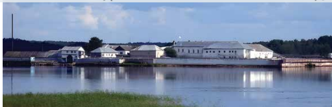
Колония для пожизненно заключенных на острове Огненный