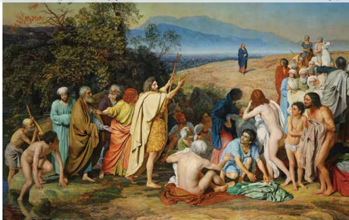
Явление Христа народу. Александр Иванов. 1837–1857.

Когда родился Иисус, Израиль находился под властью Римской империи. Людям не нравилось такое положение, они ждали Мессию, надеялись, что Он спасет Израиль от завоевателей, подобно как судья Гофониил спас страну от Месопотамского царя. И вот Иисус ходит по земле, проповедует, исцеляет, и народ следует за Ним. Многие пропускали мимо ушей суть Его проповедей, но все равно шли за Ним, потому что видели чудеса и надеялись, что рано или поздно Он использует Свою силу, чтобы прогнать римлян и восстановить независимость Израиля. Они представляли, что именно так Мессия спасет Свой народ. Но такое понимание было в корне неправильным. Другими словами, чтобы получить спасение, уготовленное нам Господом, нужно прежде всего понимать, что это такое. Если человек умирает от голода, и кто-то протягивает ему кусок хлеба, в этой ситуации каждый поймет, что в куске хлеба — спасение. Если человек болен и обращается за помощью к врачу, то здесь ситуация сложнее. Если больной считает себя умнее врача, но на самом деле абсолютно не понимает сути своей болезни, не следует рекомендациям доктора, то в результате он может потерять жизнь, в то время как спасение было так близко. Незадолго до того, как Иисус начал Свое служение, Иоанн Креститель звал людей к покаянию. Его миссия была дать уразуметь народу, что спасение — в прощении грехов, и тем самым приготовить путь Христу (см. Лк. 1:77).