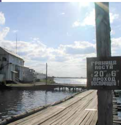
Главные ворота ИК-5